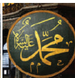
Muxammad oo ku qoran Carabi