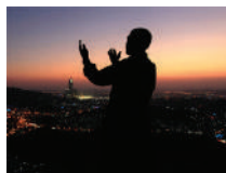
Muslim baryaya ALLAH (Ilaaha runta ah)