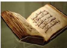
Qur'aanka Sharafta Leh