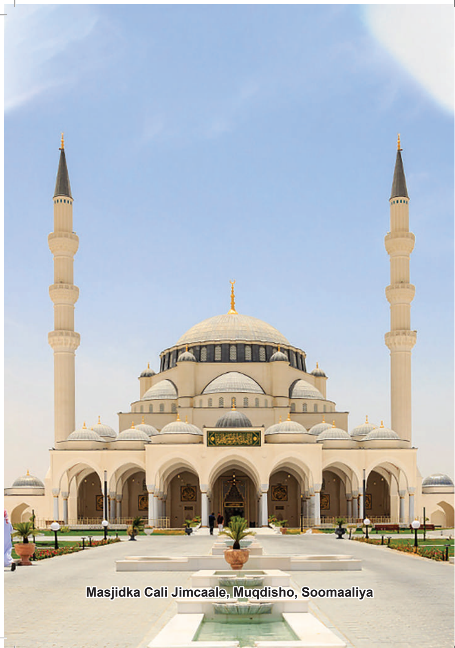
Masjidka Cali Jimcaale, Muqdisho, Soomaaliya