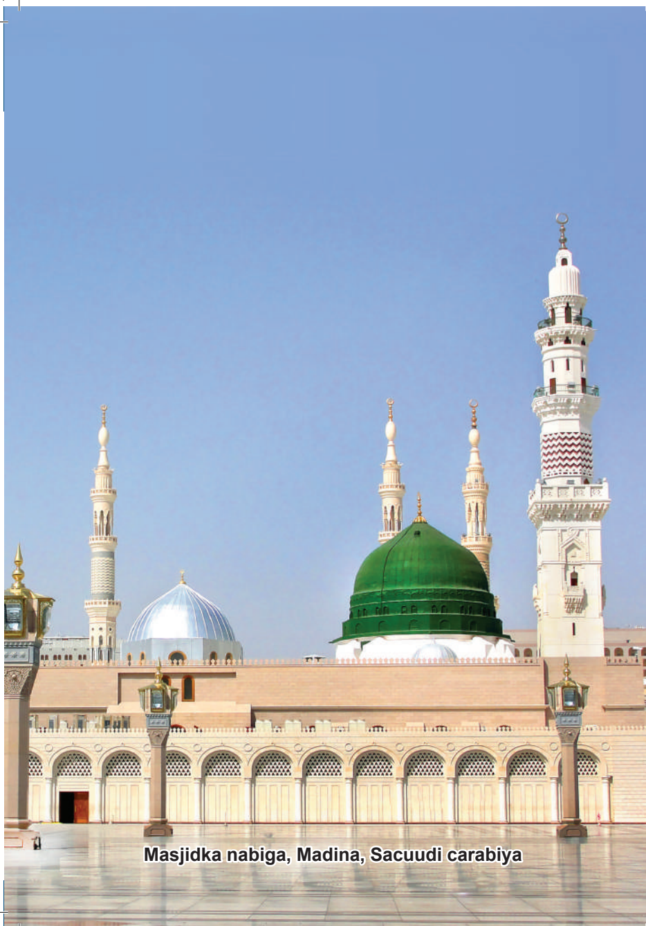
Masjidka nabiga, Madina, Sacuudi carabiya