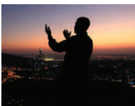
Musliman se moli Allahu