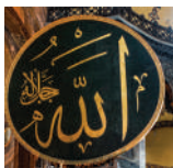
Allah na arapskom

Džamija: Čisto mesto za klanjanje koje muslimani koriste uglavnom za molitvu i bogosluženje.