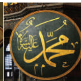
Muhamed na arapskom