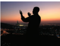
Musliman se moli Allahu