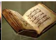
Qur'aana Ulfina qabeessa