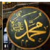
Muhammad afaan Arabaatiin