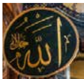
Rabbiin Afaan Arabaatiin

Masjiida (Masjiid): Bakka qulqulluu salaataa Muslimoonni irra caalaa salaataa fi ibaadaadhaaf itti fayyadaman.