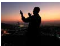
Rabbiin (Waaqa dhugaa) kadhatu