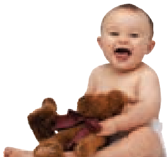
El ayuno no es obligatorio para el menor