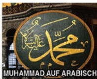
MUHAMMAD AUF ARABISCH