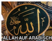
ALLAH AUF ARABISCH

Muslim: Jemand, der sich dem Willen des einen wahren Gottes (Allah), des Schöpfers, unterwirft.