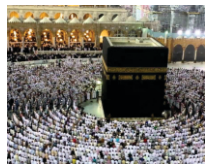
(Kaaba) em Mecca

No tempo de Jesus (que a paz esteja com ele), a direção para orar era para Jerusalém: (João 4:20-21) . Jesus disse que os verdadeiros adoradores, adorarão a Deus em "espírito e verdade": (João 4:23-24) , o que significa "eles serão sinceros em sua adoração", não significa que adorarão a Deus em alguma direção determinada . Jesus cuidadosamente seguia os profetas e rezava em direção ao Templo Sagrado.