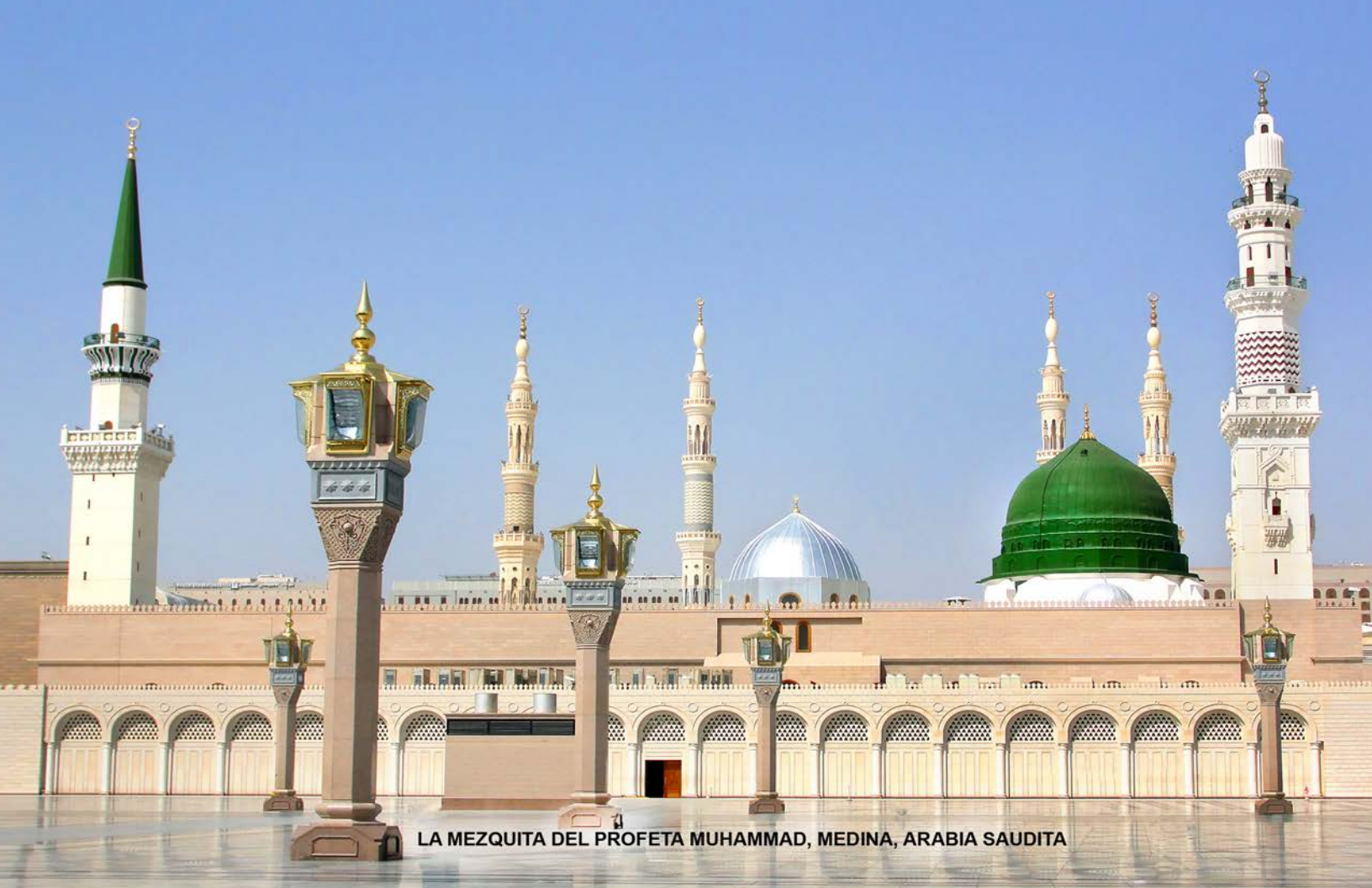
LA MEZQUITA DEL PROFETA MUHAMMAD, MEDINA, ARABIA SAUDITA