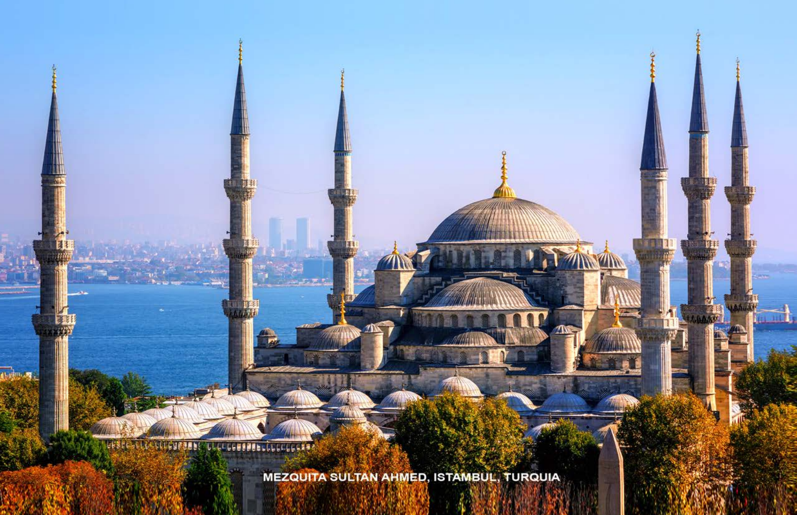
MEZQUITA SULTAN AHMED, ISTAMBUL, TURQUIA