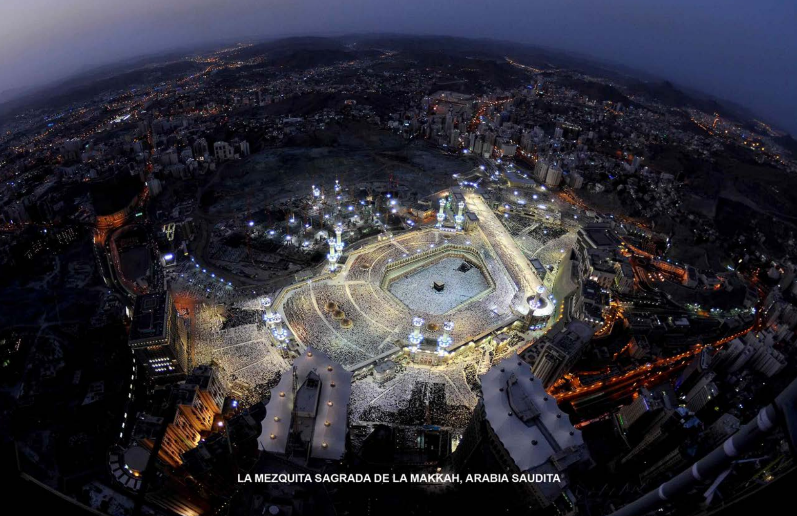
LA MEZQUITA SAGRADA DE LA MAKKAH, ARABIA SAUDITA