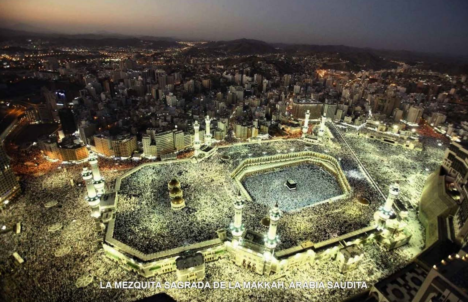
LA MEZQUITA SAGRADA DE LA MAKKAH, ARABIA SAUDITA