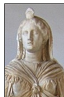
Izyda, Muzeum Kapitolińskie, Rzym, I wiek n.e.