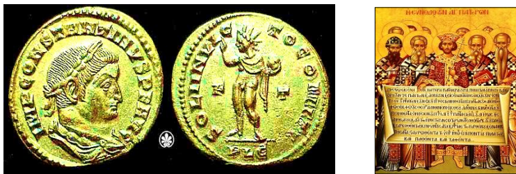
Rysunek 10: Po konwersji Konstantyna na chrześcijaństwo, kontynuował on wybijanie monet z bogiem słońca (z lewej). Zwołał synod w Nicei (z prawej), by rozpatrzył kwestię boskości Jezusa (pzn).

Ponadto, w celu zapewnienia zgodności Nowego Testamentu z przyjętą wersją pawłowego chrześcijaństwa, przynajmniej 13 z zebranych 27 ksiąg Nowego Testamentu zostało napisanych przez Pawła (tabela 2).