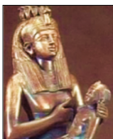
Izyda karmiąca Horusa

Kult Izydy rozprzestrzenił się po grecko-rzymskim świecie (rysunek 5). Na przykład, istniało coroczne rzymskie religijne święto na cześć bogini Izydy obchodzone co najmniej do roku 416 naszej ery. Aby przyciągnąć jej wiernych do chrześcijaństwa, Kościół zastąpił ją Marią (pzn). Dlatego kult Marii nie jest biblijny - ma korzenie w pogańskich, starożytnych praktykach egipskich i nigdy nie był nauczany przez Jezusa (pzn).