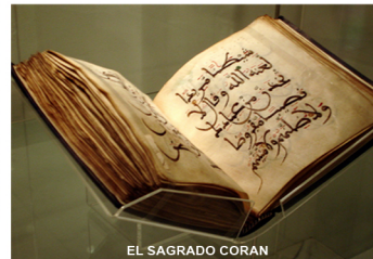
EL SÁGRADO CORAN