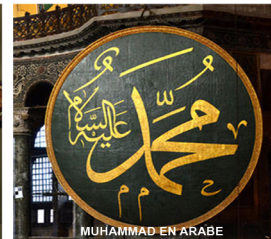
MUHAMMAD EN ARABÉ