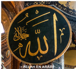
ALLAH EN ARABÉ

Musulmán: el que se somete a la Voluntad del Único Dios Verdadero (Allah), el Creador.