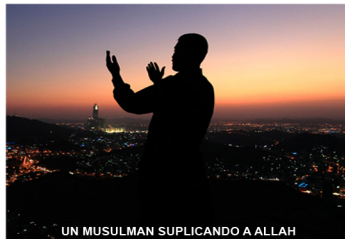
UN MUSULMAN SUPLICANDO A ALLAH