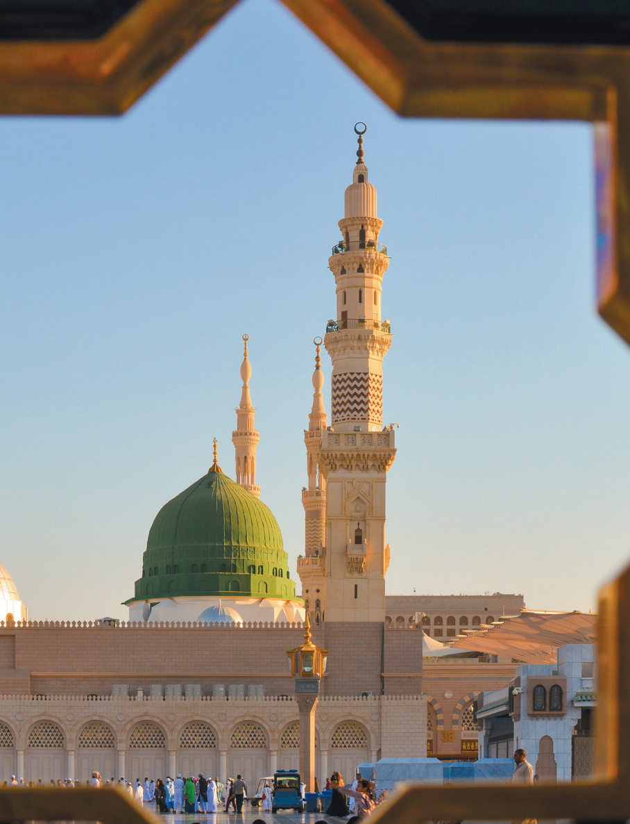
Prophetische Moschee | Medina, Saudi Arabien