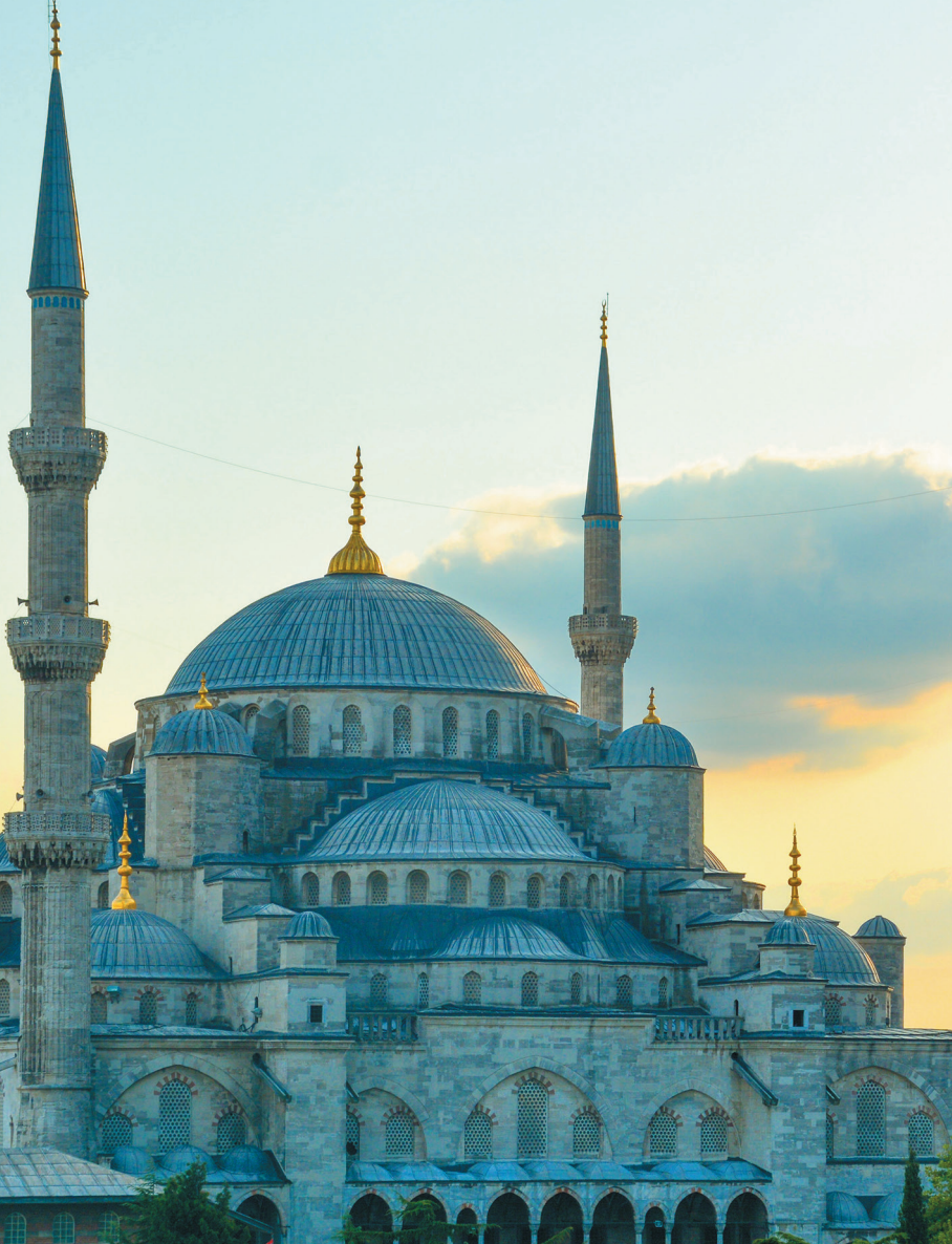
Sultan Ahmed Mosque | Istanbul, Türkei